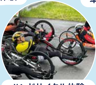
ハンドサイクル体験