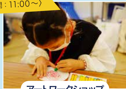
アートワークショップ